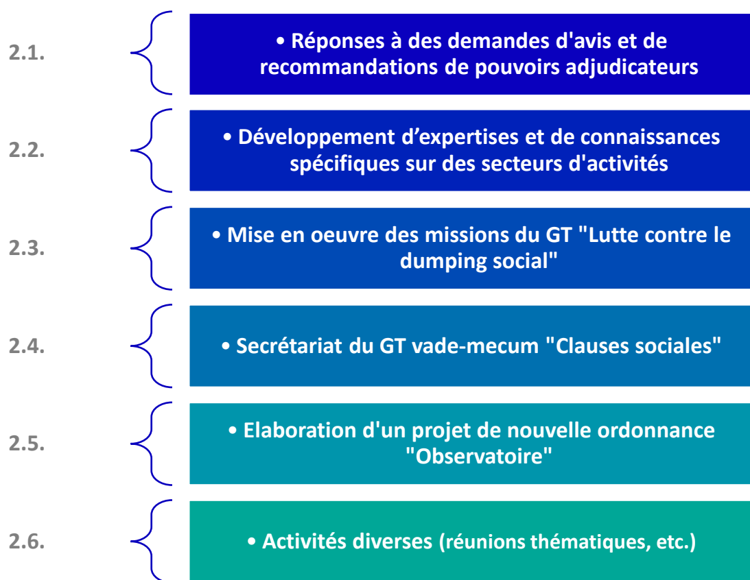
Figure 1- Activités de l'Observatoire

Afin de remplir les missions précitées, l'Observatoire a travaillé en 2020 à plusieurs actions, déclinées en 6 activités (les activités reprises dans la figure sont détaillées ci-après) :