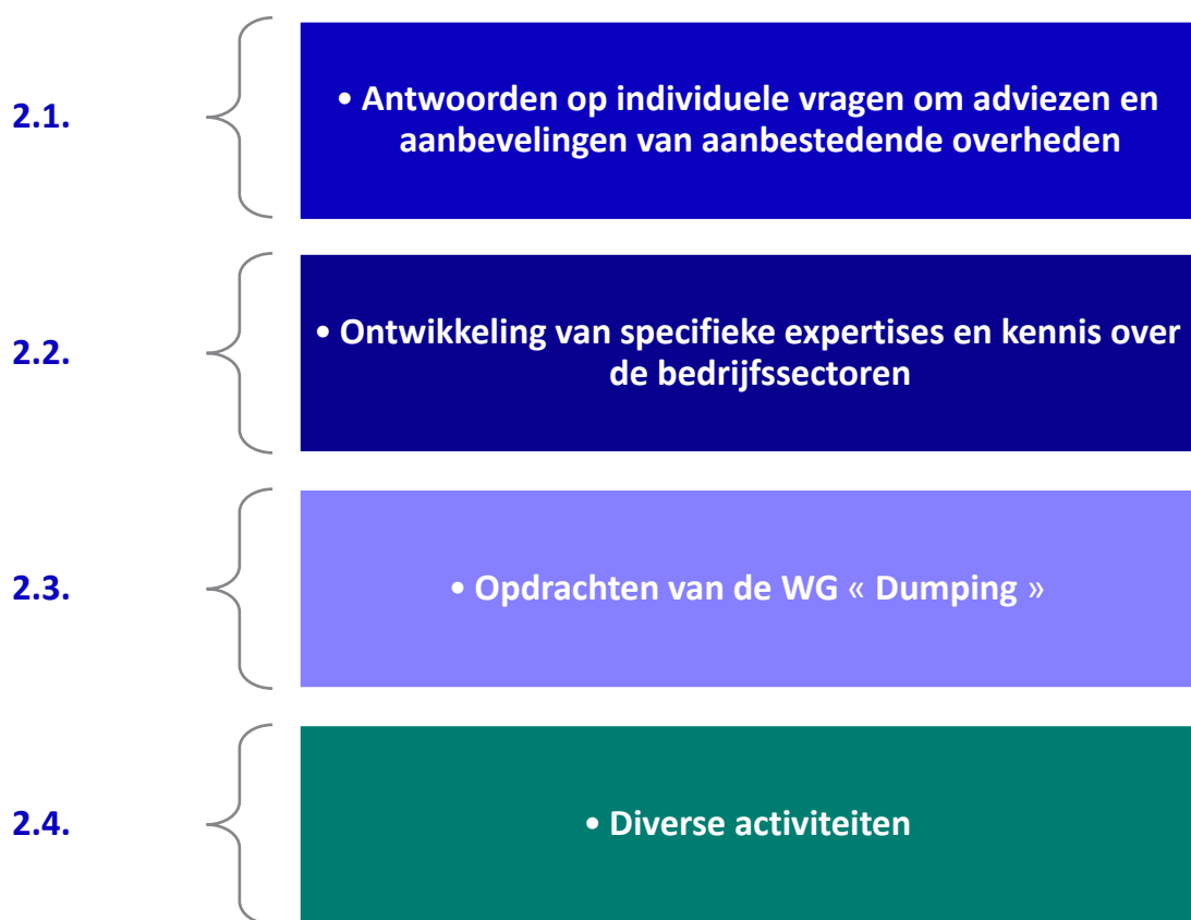
Figuur 1- Activiteiten van het Observatorium

Voor de vervulling van deze opdrachten heeft het Observatorium in 2024 aan verschillende acties gewerkt, die in 4 activiteiten zijn onderverdeeld (de activiteiten die in de figuur zijn opgenomen, worden later gedetailleerd):