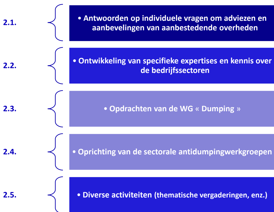
Figuur 1- Activiteiten van het Observatorium

Voor de vervulling van deze opdrachten heeft het Observatorium in 2022 aan verschillende acties gewerkt, die in 5 activiteiten zijn onderverdeeld (de activiteiten die in de figuur zijn opgenomen, worden later gedetailleerd):