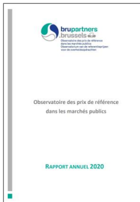
Figuur 4 – Jaarverslag 2020

Het Jaarverslag van het Observatorium van de referentieprijzen voor de overheidsopdrachten bevat alle activiteiten die in 2020 werden uitgeoefend.