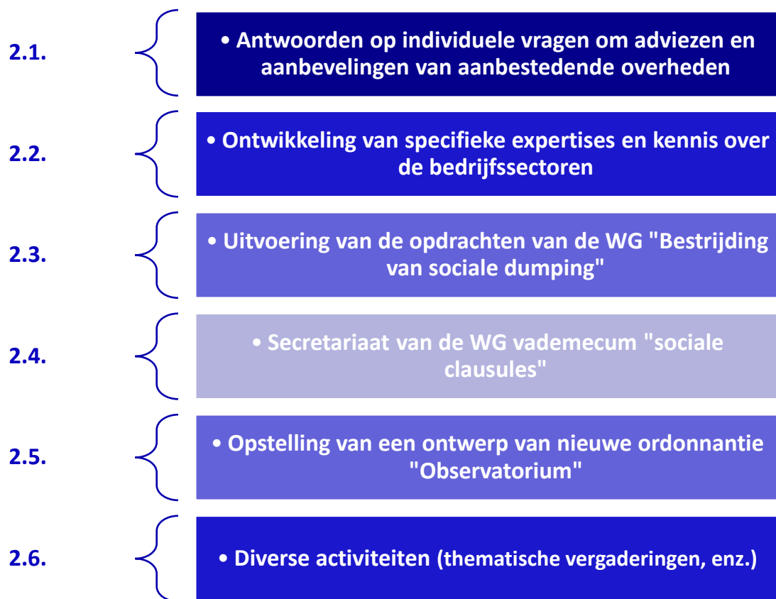
Figuur 1- Activiteiten van het Observatorium

Voor de vervulling van deze opdrachten heeft het Observatorium in 2021 aan verschillende acties gewerkt, die in 6 activiteiten zijn onderverdeeld (de activiteiten die in de figuur zijn opgenomen, worden later gedetailleerd):