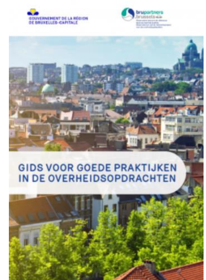
Figuur 5 – Gids van goede praktijken voor overheidsopdrachten