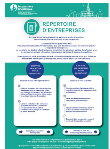
Figuur 2 – Infografie over het gebruik van het bedrijvenregister