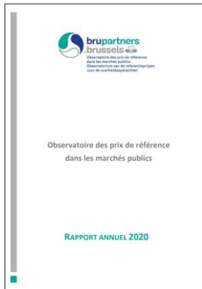
Figure 4 : Rapport annuel 2020

Le Rapport annuel de l'Observatoire des prix de référence dans les marchés publics reprend toutes les activités menées en 2020.