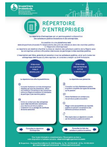
Figure 2 – Infographie relative à l'usage du répertoire d'entreprises