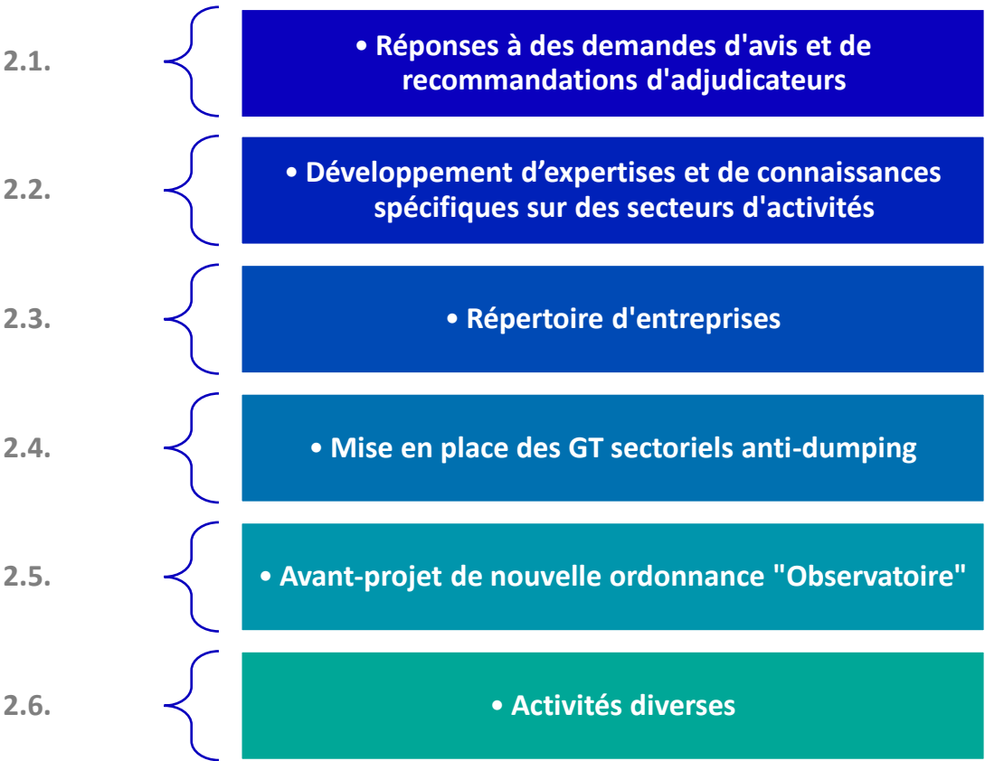
Figure 1- Activités de l'Observatoire

Afin de remplir les missions précitées, l'Observatoire a travaillé en 2021 à plusieurs actions, déclinées en 6 activités (les activités reprises dans la figure sont détaillées ci-après) :